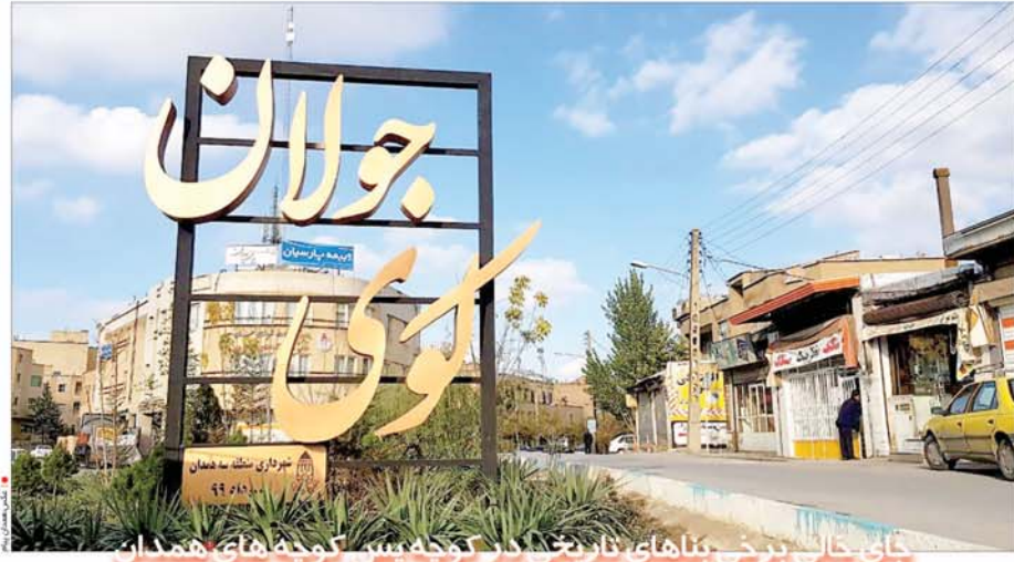
جای خالی برخی بناهای تاریخی در طرح جدید کوکوی همدان

روزنامه همدان تاسیس: ۱۳۸۵ تعداد صفحات: ۱۲