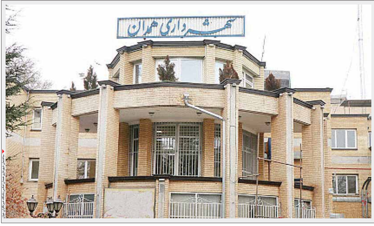
شهردار همدان به دعوت رسمی سازمان ملل متحد برای شرکت در کنفرانس جهانی «کاهش خطرپذیری» به اندونزی سفر کرد و به عنوان یکی از سه سخنران اصلی انتخاب شد تا مدل تاب‌آوری همدان را در این کنفرانس ارائه کند.

ظرفیت همدان در تبدیل به مرکز تاب‌آوری غرب آسیا