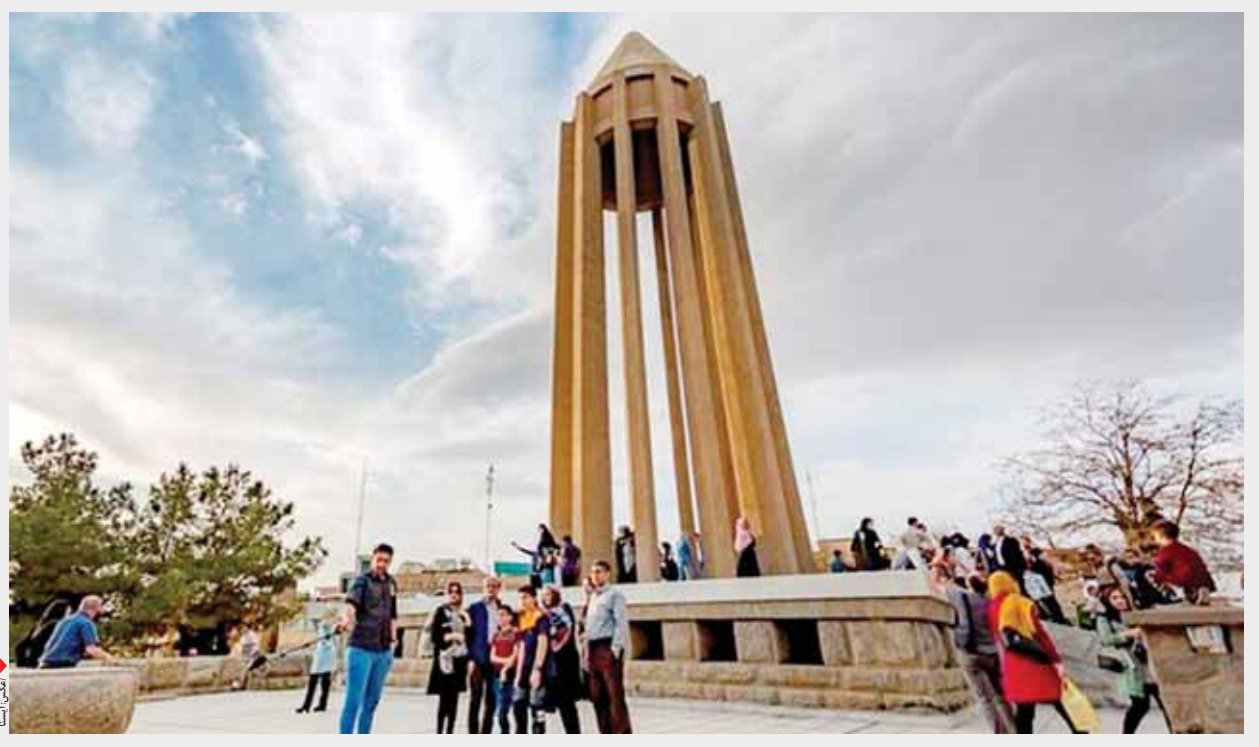
تیم باغ نظری در همدان

دیرخانه ستاد خدمات سفر در باغ نظری فعال است