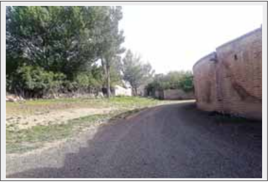
کاروانسرای تاج آباد همدان

بهار - مینابراهیمی - خبرنگار همدان پیام: در ادامه سفرهای روستایی به یکی از روستاهای زیبای توابع بخش مرکزی شهرستان بهار که در غرب استان همدان واقع شده است رفیقیم؛ روستایی که اثری بسیار باارزش و قدیمی را در خود جای داده است و زمستان سال گذشته پای کارشناسان یونسکو را به این روستا باز کرد تا این اثر باارزش را که واجد شرایط ثبت جهانی است، براساس بررسی و اعلام نتایج به اثری جهانی تبدیل کند که گویا چندماه آتی نتایج مشخص خواهد شد.