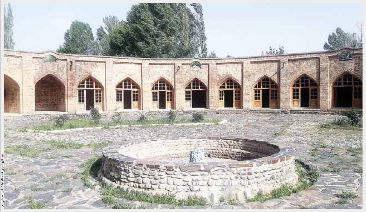
کاروانسرای تاج آباد همدان