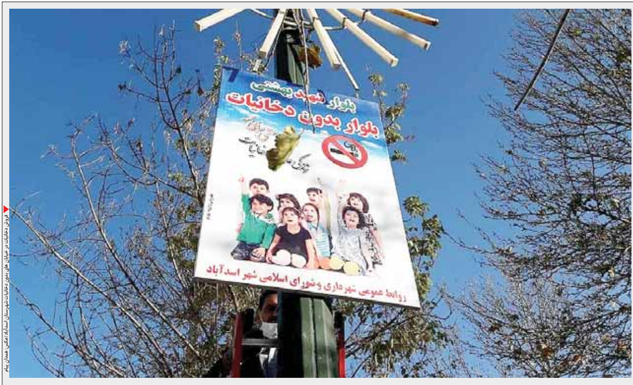
فروش دخانیات در خیابان بدون دخانیات شهرستان اسلامشهر

اسدآباد- محمد جواد کوهی- خبرنگار همدان پیام- طرح شهر و روستای بدون دخانیات طرح کشوری است که با هدف کاهش عرضه و تقاضا در زمینه مواد دخانی و قلیان و سیگار بر اساس دستورالعمل دبیرخانه ستاد کنترل دخانیات مرکز سلامت محیط و کار جمعیت شهری در همه استان‌ها اجرا می‌شود. به گزارش همدان پیام، شهر اسدآباد و روستای ملحمدره به عنوان مناطق بدون دخانیات انتخاب شده و طبق برنامه تدریجی همه مراکز توزیع و فروش دخانیات و قلیان در این مناطق محدود خواهند شد. در این برنامه با چشم انداز ۵ ساله تا اقی ۱۴۰۴ هدف، کاهش ۳۰ درصدی مصرف دخانیات در این شهر خواهد بود. در این پروژه روستای گردشگری ملحمدره هم به عنوان روستای بدون دخانیات شهرستان معرفی و هدف گذاری شده است. در این پروژه تا اقی مشخص شده تلاش می‌شود تا با همکاری مردم، اصناف و دستگاه‌های اجرایی و نظارتی به سوی شهری بدون دخانیات پیش برویم. پیش از این سازمان بهداشت جهانی چهار شهر مذهبی مکه، مدینه، قم و مشهد را به‌عنوان شهرهای بدون دخانیات معرفی کردند که در حال حاضر در کشور ما این طرح در ۶۳ دانشگاه و دانشگاه نیز در حال انجام است.