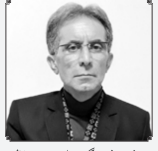
صفحه فرهنگ و ادب زیر نظر: میر مسعود حاکم زاده