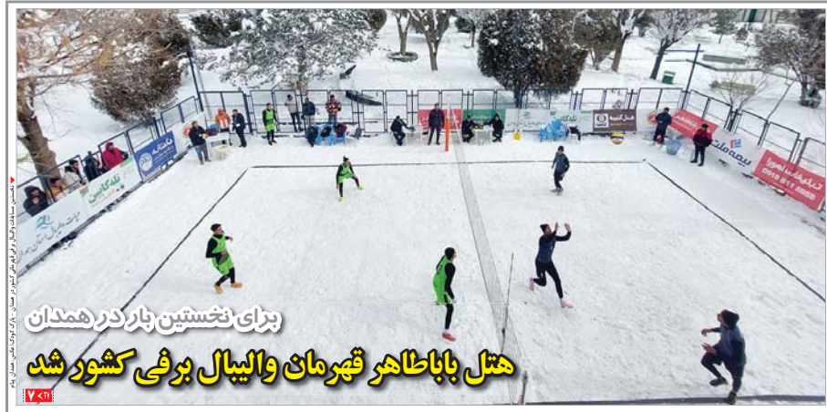
برای نخستین بار در همدان هتل باباطاهر قهرمان والیبال برفی کشور شد