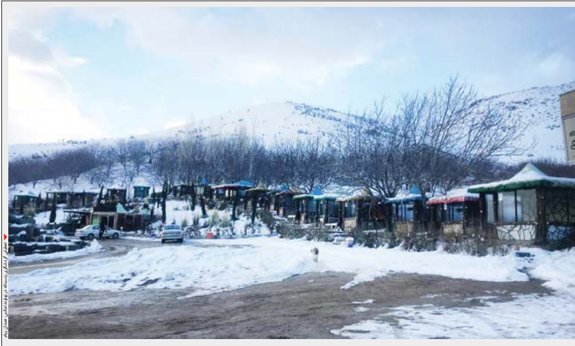
کوهستان برفی نهاوند