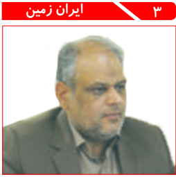
۳ ایران زمین راه اندازی بزرگترین خط تولید خوراکی آبزیان در خراسان رضوی