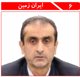
۶ ایران زمین عمارت تاریخی شهرداری رشت مرمت می شود