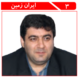
۳ ایران زمین رتبه سوم عملکرد فرهنگ و ارشاد اسلامی مازندران در کشور