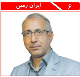
۶ ایران زمین آغاز عملیات دیجیتالی کردن اسناد ۹۰ ساله تخت جمشید