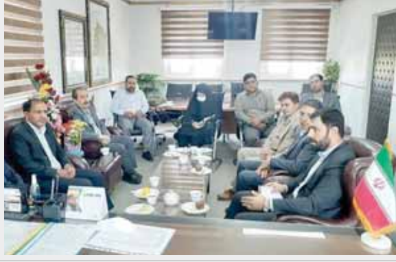
جلسه هیات تعیین تکلیف وضعیت ثبتی اراضی و ساختمان های فاقد سند رسمی