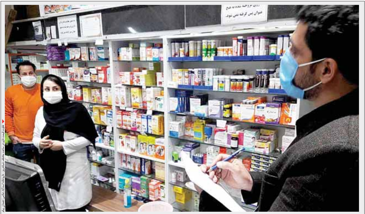
تفاوت قیمت دارو در شب و روز تفاوت دارد. در این تصویر، یک داروخانه پر از دارو دیده می‌شود.

اسدآباد- محمد جواد کوهی- خبرنگار همدان پیام-حق فنی داروخانه مبلغی است که تحت هر شرایطی بیمار در قالب نسخه خود باید به داروخانه بپردازد. مبلغی که شاید بخش دوم هزینه دریافت دارو به شمار آید. در بیشتر موارد هم برخلاف ارائه مشاوره دارویی توسط داروساز، مبلغ ریالی آن به جیب مؤسس داروخانه واریز می‌شود. موضوع دریافت حق فنی داروخانه‌ها بدون هیچ پشتوانه قانونی از سال ۶۵ آغاز و اعمال شد.