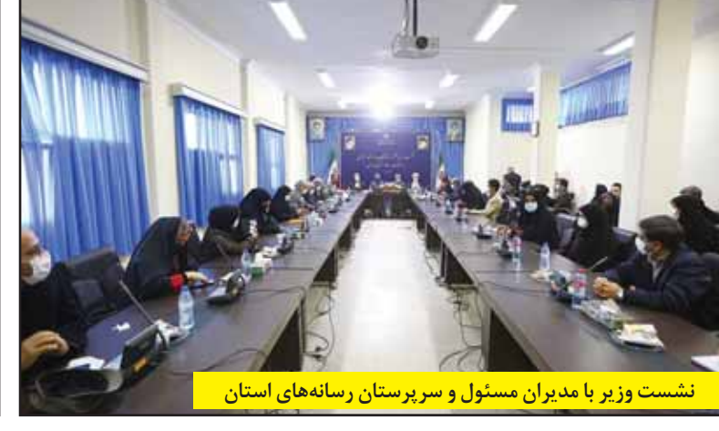
نشست وزیر با مدیران مسئول و سرپرستان رسانه‌های استان