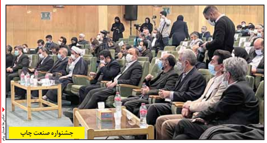
جشنواره صنعت چاپ