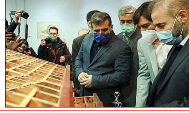
بازدید از پروژه‌های فرهنگی هنر