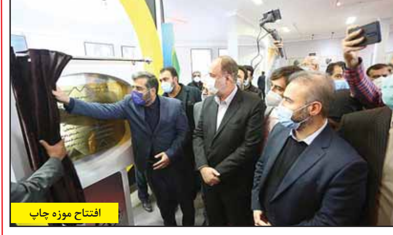
افتتاح موزه چاپ