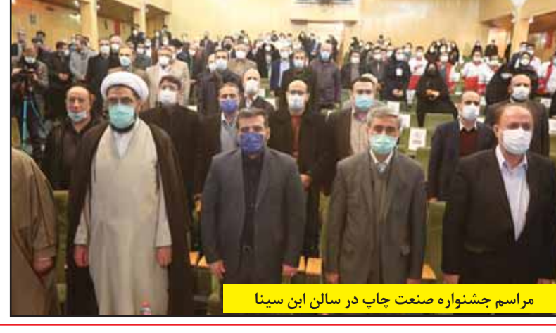
مراسم جشنواره صنعت چاپ در سالن ابن سینا