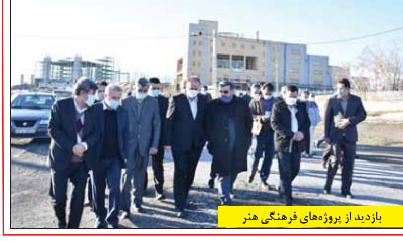
بازدید از پروژه‌های فرهنگی هنر