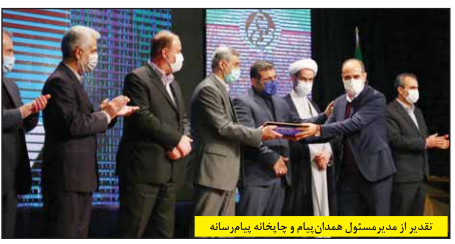
تقدیر از مدیرمسئول همدان پیام و چاپخانه پیام رسانه