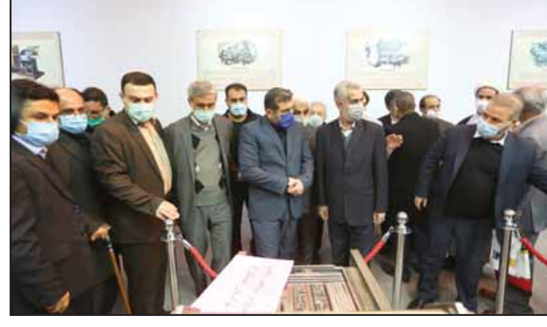
مراسم جشنواره صنعت چاپ در سالن ابن سینا