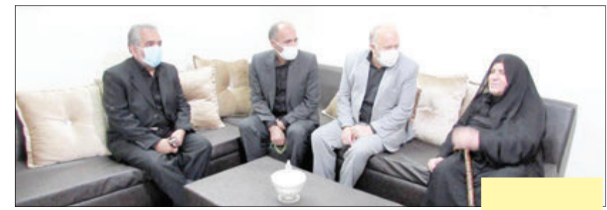
با تلاش شبانه‌روزی کادر پزشکی و درمانی و پرستاران اسدآباد در شناسایی و غربالگری کرونایی همچنان در جایگاه اول تا سوم کشور قرار دارد. کادر پزشکی و درمانی و پرستاران اسدآباد با ۹۰ درصد بهبودی کرونایی یکی از شهرستان‌های موفق بوده است

او با بیان اینکه پروژه ملی سد نعمت‌آباد اسدآباد سرانجام پس