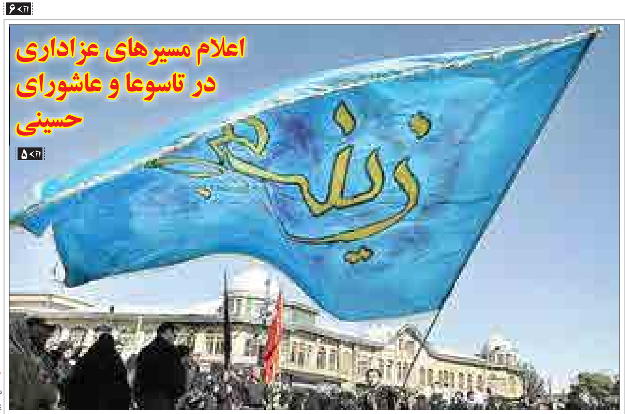
اعلام مسیرهای عزاداری در تاسوعا و عاشورای حسینی